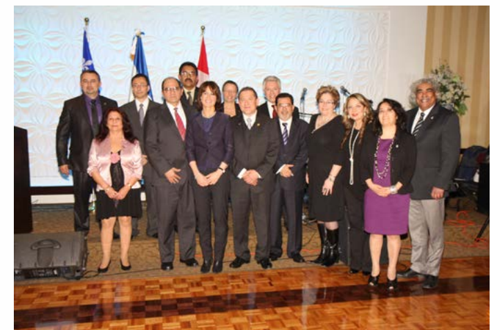
Gala de lanzamiento de la CCSQ