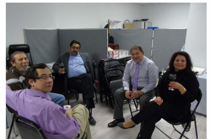
Encuentro de miembros fundadores